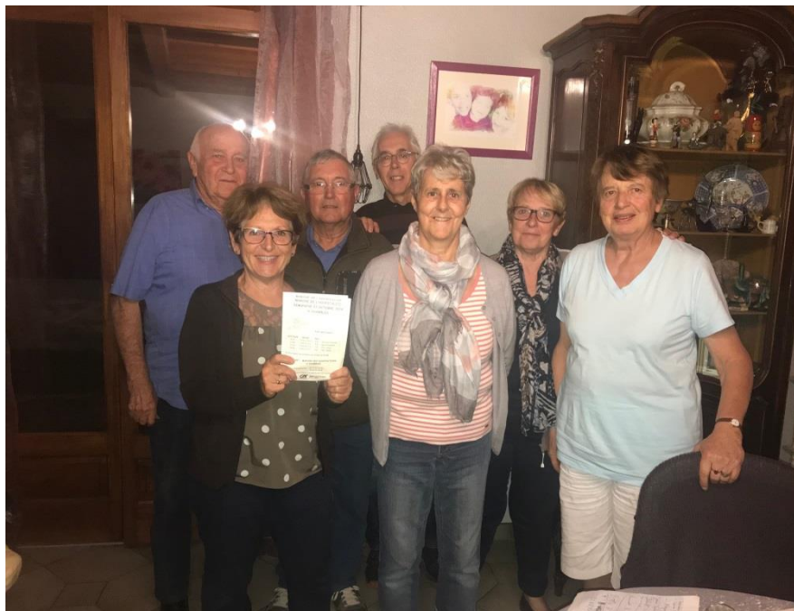
L'équipe organisatrice de la marche