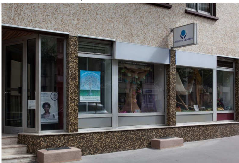
Le local à St Etienne, 41 rue du 11 Novembre